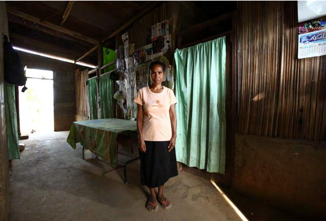
Augusta iha nia uma nia laran

Bainhira ha'u nia aman sai husi uma nia ho kondisaun di'ak maibé iha tempu ami haree nia, ninia isin bubu hotu, fraku no hanesan la hetan tratamentu di'ak ka hahaan ne'ebé nato'on.