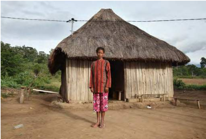
Agripina iha nia uma nia oin