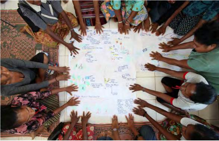
Feto sobrevivente sira husi Marabia tau sira nia liman iha sira nia mapa comunidade nia leten