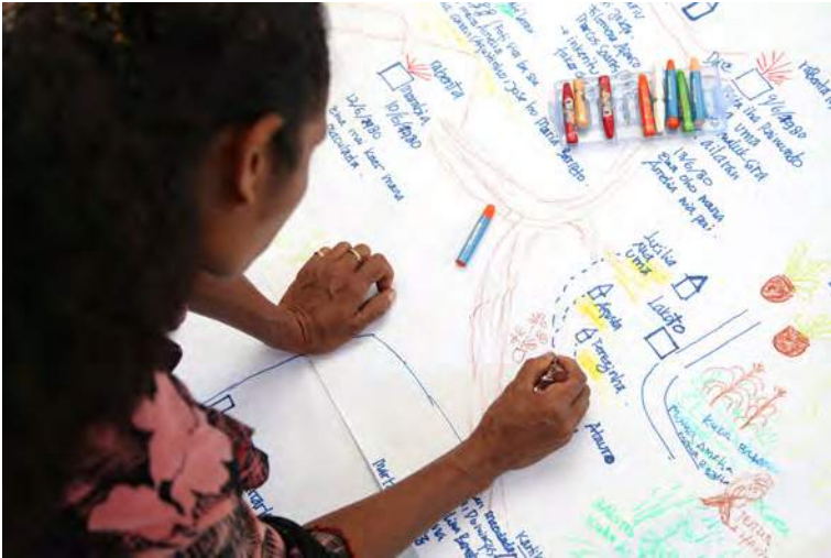
Feto sobreviviente pinta nia mapa comunidade

Faze ba tempu ida halo atu komprende violénsia ne'ebé akontese ba feto molok, durante no depois de konfliktu. Ami konsege harí história kolektivu ho prespetiva ne'ebé luan liu duke ne'ebé konsege hetan husi individu sira.