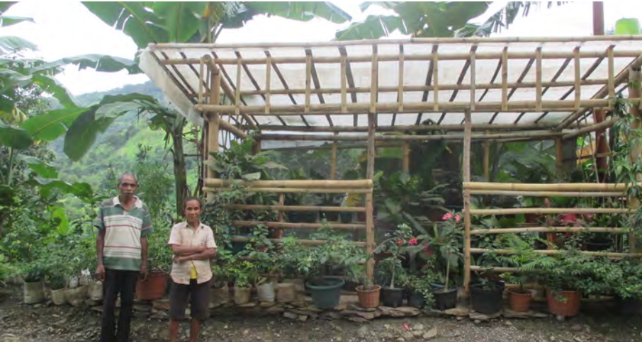
Domingas ho nian kaben hamri iha sira nia loja simples fan ai-fuan nia oin

Liutiha tinan ida, Cruz Vermelha vizita sira hodi fo kondisaun ne'ebé di'ak liu ba sira.