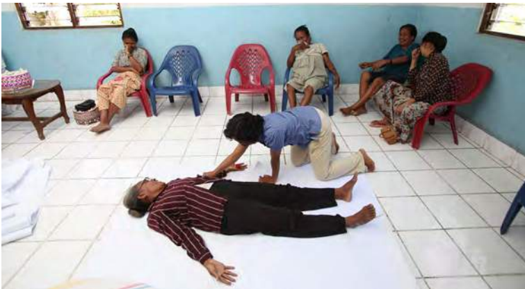
Feto sobrevivente pinta mapa isin-lolon

Métodu ne'e adopta husi movimentu ba saúde reproduisaun fetu, ami uza mapeamentu isin-lolon nudar oportunidade ida ba vítima fetu atu ko'alia kona-ba oinsá violénsia ne'ebé sira hetan ne'e fó impaktu ba sira-nian isin-lolon. Alende sente moras, ami mós dudu sira atu fó sinal iha area parte sira-nian mapa isin-lolon