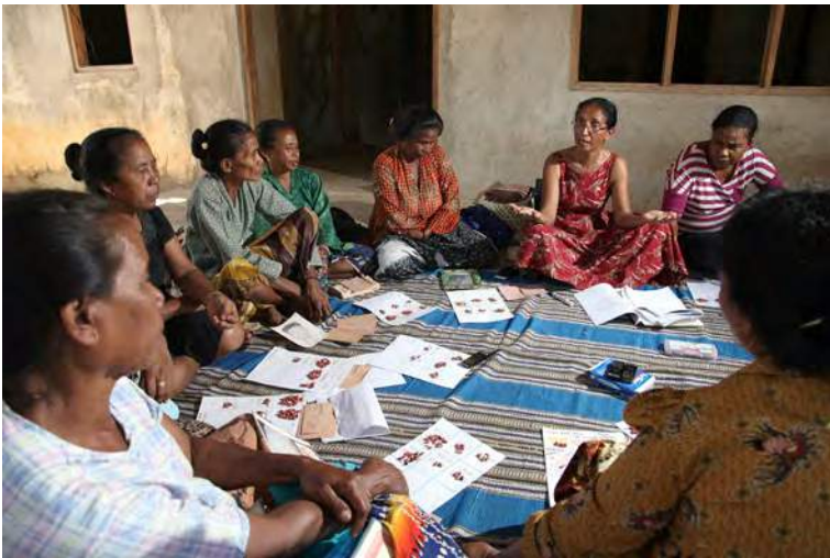
Fetu sobrevivente sira husi Bobonaro halo diskusaun kona-ba sira nian rekursu ekonómiku antes ho liu tiha konflitu

Iha relatóriu ne'e, termu "vítima no sobrevivente utiliza troka-malu maibé refere ba asuntu ne'ebé hanesan. Ami uza termu "vítima" atu deskreve definisaun legal ne'ebé utiliza iha konvensaun no tratadu direitu umanus. Ami mós utiliza lia-fuan "sobrevivente" atu fó atensaun ba vítima nian fortaleza no sira-nian kbiit atu rekupera no ajuda vítima sira seluk. Ami fiar katak vítima no sobrevivente tenki iha liberdade atu identifika sira-nian a'an rasik nudar vítima, sobrevivente ka termu seluk ne'ebé sira hakarak.