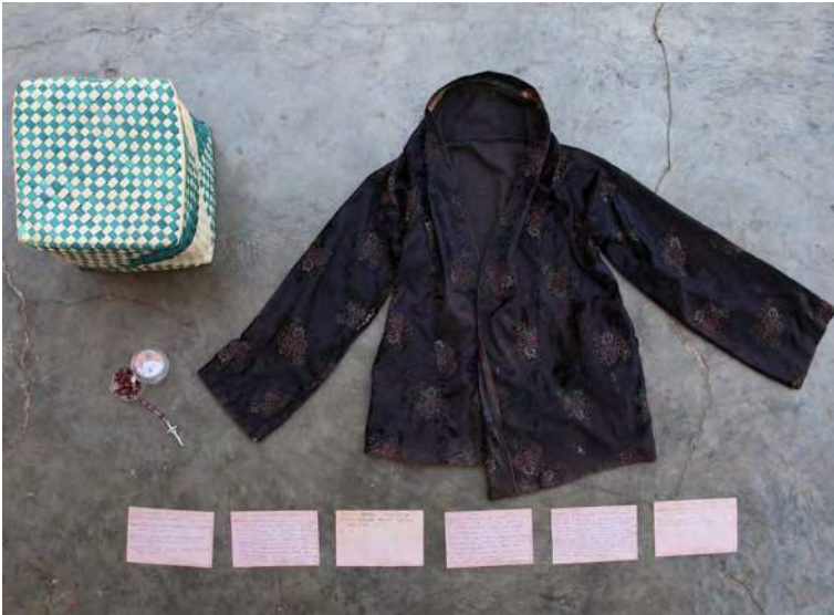
Sobrevivente ida nian kaixa memória

Peskizador sira vizita fetu sira-nian uma atu halo foto konta istória kona-ba sira-nian moris, inklui foto ba fatin sira no sasan ne'ebé iha signifikadu ba sira.