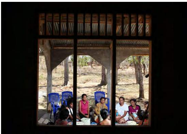
Sobrevivente husi Bobonaro fahe esperiênsia ba malu liu husi sira nian kaixa lembransa

Molak invazaun ho eskala boot, forsas armadas Indonézia servisu hamutuk ho “partisan” Timor oan atu invade area sira besik fronteira no halo atake aereo, maritima no terrestre kontra forsa armada Fretilin. Komunidade evakua ba foho sira, husik hela sira nia natar, to’os, moris ho sira nia ai-hahaan rezerva. Ema barak husi distritu Maliana mak sai fujileiru hodi ultrapasa liuhusi fronteira Timor Osidental hodi bá Atambua. Sira fila hikas mai Timor-Leste depois de tinan ida maibé sira nia uma rahun hotu ona. Hanesan akontesimentu sira iha parte balun Timor-Leste nian, atake no inkapasidade atu halo to’os kauza ba akontesimentu boot ba hamlaha iha períudu 1970 i tal no hahú tinan 1980. 36