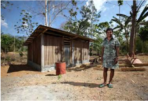
Iria iha nia uma nia oin

Ha'u labele tan ona atu sura sira rein ha'u dala hira. Ha'u labele tan sura sira sunu sira nia sigaru ba ha'u nia susun-matan. Ha'u labele tan atu sura sira sunu ha'u nia husar dala hira? Sira hao ami hanesan feto aat.