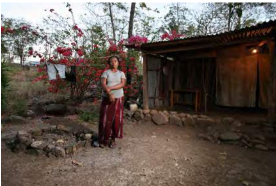
Victoria iha nia uma oin