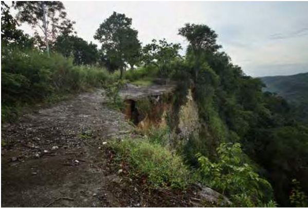
Rai-ku'ak naruk Builico, mós koñesidu ho naran Jakarta II

Iha fulan Fevereiro 1976, tropas Indonézia sama ona ain iha área foho iha parte sul munisípiu Ainaro. Feto sira husi Ainaro haktuir sira nia istória kona-ba bainhira sira evakua ba ai-laran no foho atu hasees an husi tropas Indonézia nia persegisaun, muda husi fatin ida ba fati seluk, luta atu hetan ai-han no subar husi bombardeamentu. Sira barak mak hela iha ai-laran to'o tinan 1970 nia ikus, molok atu kaptura ka obrigadu tun ba rende tanba kondisaun moris iha ai-laran ne'ebé kada vez pior liutan.