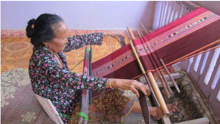
Prisca buka moris ho soru tais

Iha tinan 2002 Unidade Krime Seriu – ONU sira lori ha'u ba Dili atu akompanha julgamentu maibé julgamentu ne'e la lao ho di'ak tamba milisia hirak ne'ebé oho ha'u nia la'en sei iha Atambua-Indonézia. Iha tempu ne'ebá, julga milisia ida de'it no nia hetan penaprizaun tinan 2.