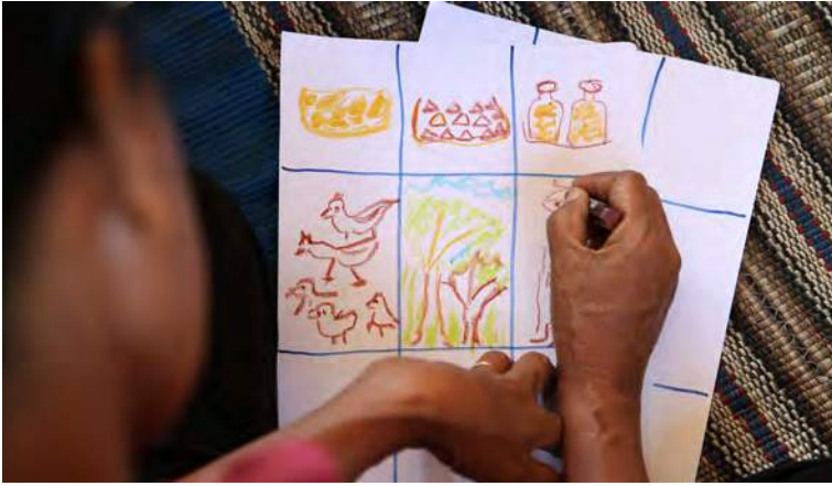
Feto sobrevivente husi Bobonaro pinta nian mapa rekursu