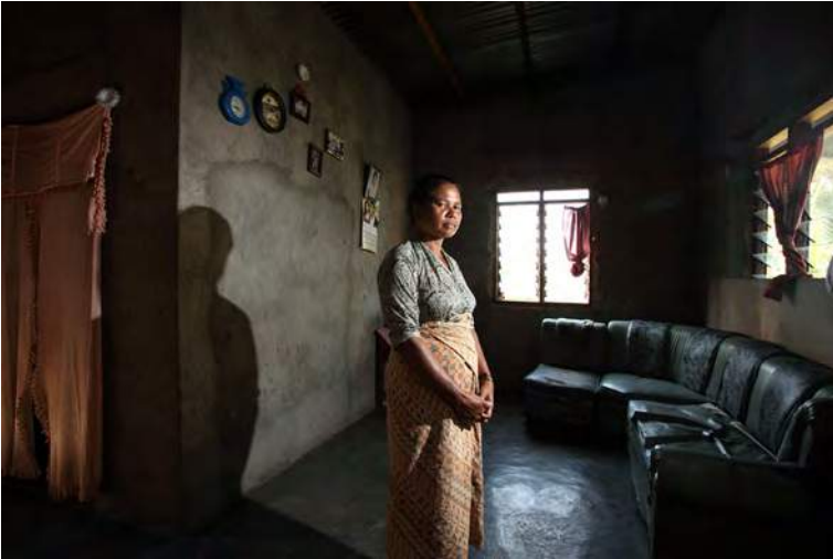
Herminia iha nia uma nia laran

Militár tortura ha'u nia la'en no to'o ikus nia mate. Nia husik hela ha'u ho oan barak. To'o oras ne'e laiha ema ida mak fó atensaun ba ami nia vida. Timor-Leste hetan ona ukun-rasik an, maibé governu laiha interese ba ha'u.