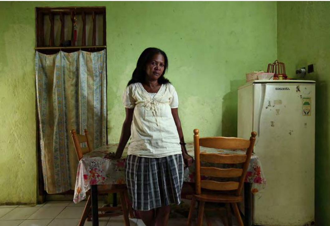
Felismina iha nia uma nia laran

Terus no lakon ne'ebé rohan laek: Feto nian esperiénsia iha akontesimentu Marabia