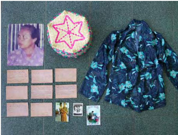
Herminia nia kaixa lembansa

Justisa mak liafuan ne'ebé dala barak ha'u rona ema ko'alia maibé realidade ka lae, ha'u la hatene tanba ha'u nunka hetan esperiénsia nee. Ami terus ba hamlaha no krize ekonomia, maibé laiha ema ida mak iha interese ba ami. Ha'u la hatene prosesu justisa iha ne'ebé. Ha'u nunka rona kona-ba buat ne'e.