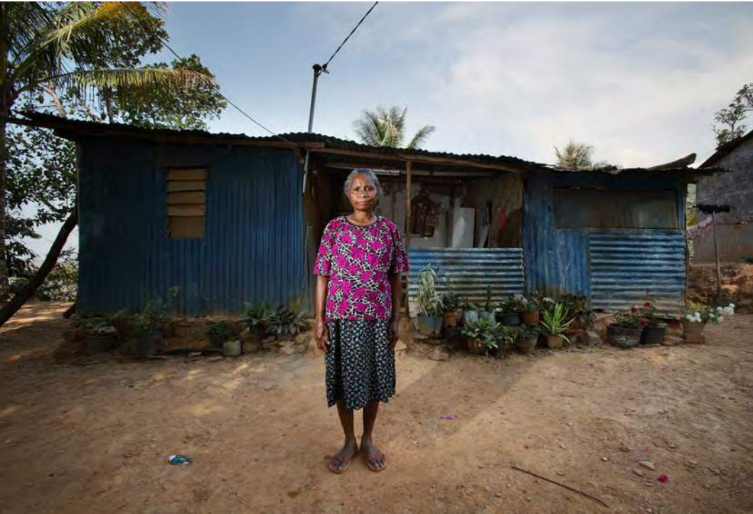
Amelia iha nia uma nian oin

Terus no lakon ne'ebé rohan laek: Feto nian esperíensia iha akontesimentu Marabia