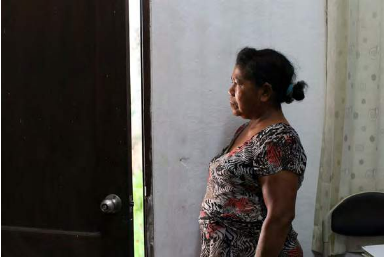
Ne'e mak fotografia husi eis prisoneira política husi Timor-Leste no nian istoria

Ha'u hanoin katak depois-de ukun a'an, ita bele livre husi violénsia hotu. Maibé, iha ha'u-nian moris [agora], ha'u la hetan liberdade no ha'u-nian direitu.