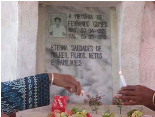
Prisca nia kaben nian rate

Prisca nia la'en halai sai ba liur no ema tiru nia iha dapur nia odamatan oin.