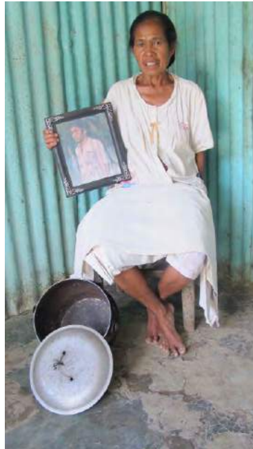
Domingas kaer nia kaben nian foto

Ami la moris hakmatek, kalan-kalan Koramil haruka ema mai intimidada no ameasa ami. Sira halo planu atu oho ami, maibé tropas Indonézia ida nia feen haruka nia oan feto hodi hato'o ba ami atu ami sai kedas iha kalan ne'ebá duni. Ha'u bolu ha'u nia primu na'in rua no ami na'in haat sai husi uma. Iha tempu ne'ebá udan bo'ot, ami la'o ba sede sub- distritu. Ami hela iha nia uma no dadeersan ha'u nia la'en husu ba nia, "ami bele muda ba Dili".