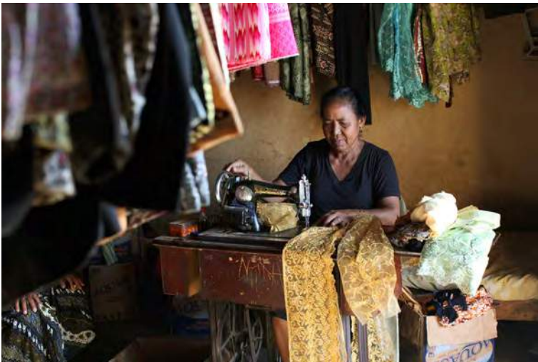
Domingas buka moris liu husi modista

Sira sona nia baihira sira iha hela formatura nia laran. Nia konsege halai ba ami nia uma ho kondisaun kanek grave, iha tempu ne'ebá ami hela iha asrama Kodim. Ha'u tanis no halerik bainhira haree ninia kondisaun. Ha'u husu nia tanba sa maibé nia difisil atu ko'alia tanba nia susar atu dada iis. Ami aranka ba Atambua maibé nia iis kotu molok ha'u atu lori nia ba hospital. Ami hakoi nia iha Atambua tanba ne'e mak ha'u hela Atambua. Liutiha tinan ida ha'u simu ninia osan reforma.