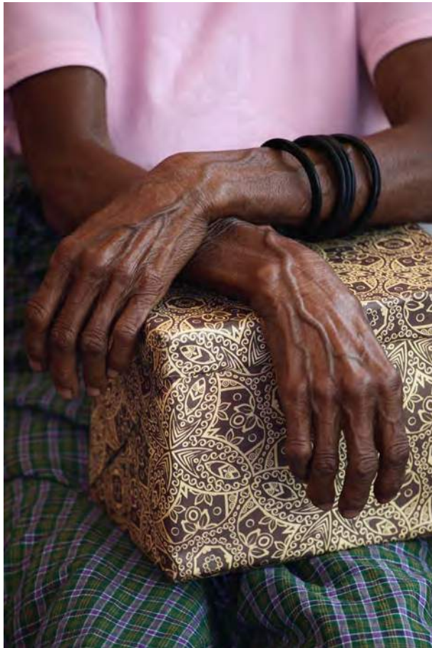
Fotografia fetu sobrevivente nian liman

Ami sei asegura katak informasaun ne'ebé identifika ema sira ne'ebé involve iha peskiza ne'e sei la disponivel ba ema seluk fora husi siklu peskiza ne'e, no sei la utiliza iha publikasaun saida de'it, eseptu Sei karik sujeitu ho klaru deklarasaun ninian hakarak ka ninian konsentementu katak ninian naran sei mensiona.